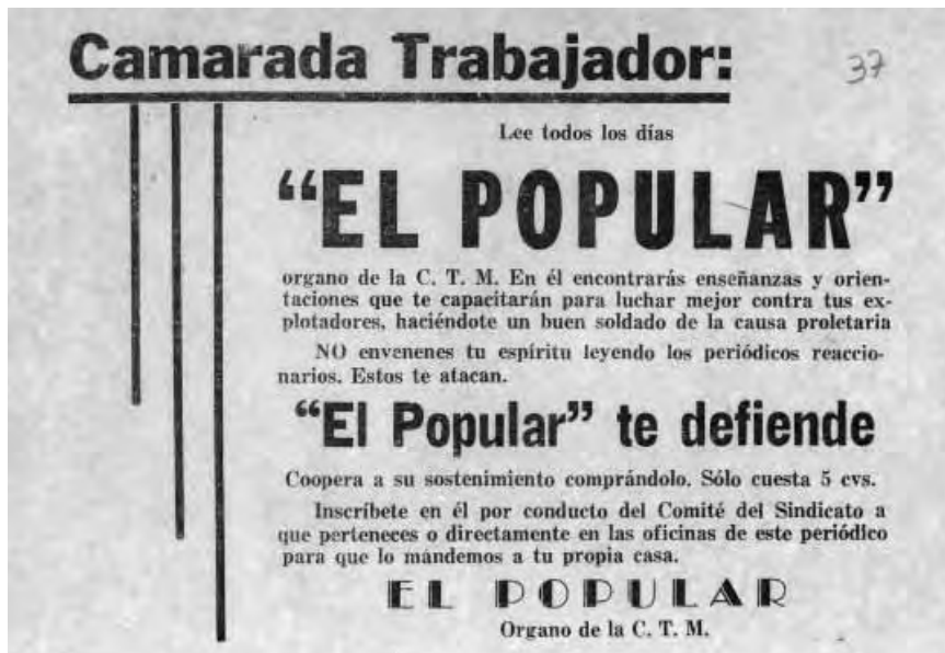
Volantes repartidos en la manifestación contra la prensa reaccionaria, el 3 de agosto de 1938.

con estas cosas. Otro dijo: dijeron que me corrían si no venía pero no desfilo aunque me corran. Un observador dijo: Toledano es el payaso de la revolución. Otro observador exclamó: ahí va la “borregada” de Toledano. A un señor que estaba ahí en el grupo le oí decir: que la CTM. quería decir COMO TRASQUILAN MAJES.