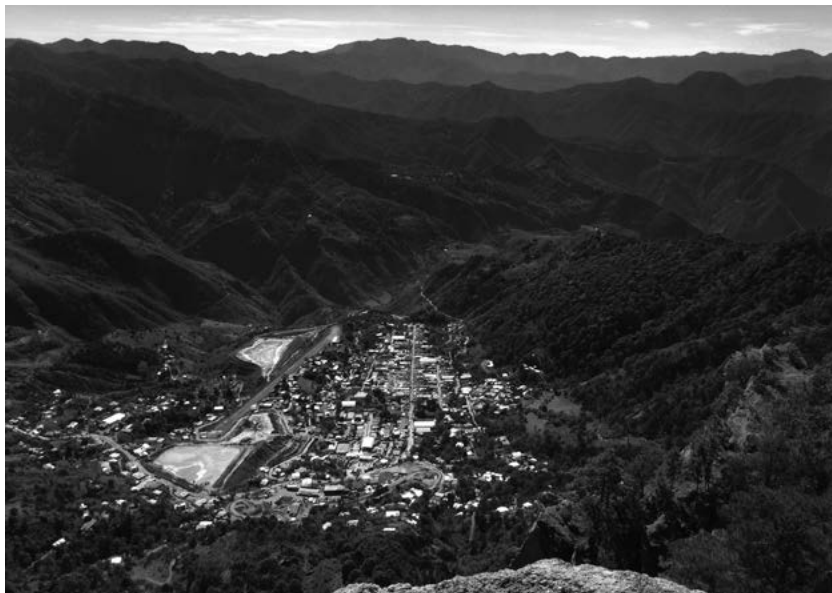
Vista panorámica del pueblo de Topia (antiguo real de minas).

En la Nueva Vizcaya hubo cuatro categorías de trabajadores forzados; estaban los indios esclavos, los laboríos, 45 los de repartimiento (a quienes se les retribuía con un salario) y los de encomienda (regularmente sin salario). Entre los esclavos y los de encomienda casi no existía diferencia, pues los dos eran sometidos a la misma violencia. 46 En la sierra los indios de repartimiento eran los mexicas y tarascos, así como algunos acaxees que por su propia cuenta se rentaban para el trabajo en las minas. 47 De cualquier forma, tanto los indios de encomienda, como los de repartimiento, eran distribuidos cada temporada a sus encomenderos. 48 Es decir, estaban sujetos al mando de un español.