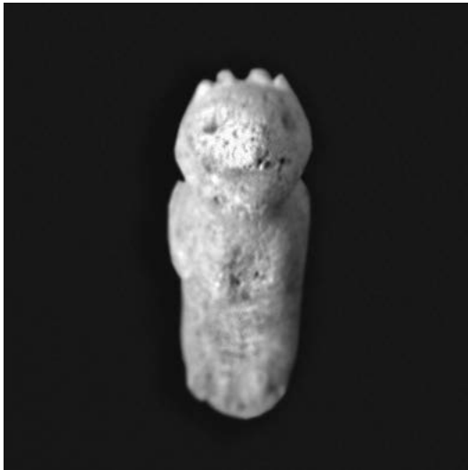
Vista frontal de la pieza en forma de águila.