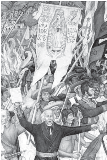
Retablo de la Independencia (frag.). Juan O'Gorman, Fresco, 1960 en México: Independencia y Soberanía , AGN, México, 1996

un criollismo que concibió en sí y para sí lo que sus defensores posteriormente llamaron «nación americana», sino, fundamentalmente, se trató de expresiones culturales más o menos articuladas para responder a una serie de acontecimientos políticos debidos tanto al proceso de ilustración en Hispanoamérica en su conjunto, como a sucesos políticos relacionados directamente con la integración/desintegración de la monarquía española. Este último rasgo ha causado toda una polémica en torno de los estudios sobre las independencias americanas. Un tercer elemento que compartieron fue que las tres representaciones, en su producción y circulación, se valieron de los principales canales de difusión como la prensa, la oratoria sagrada, los rituales político-religiosos de la ciudad, es decir, se inscribieron en la esfera pública como un asunto que debía ser compartido por los habitantes de los distintos territorios de la monarquía española.