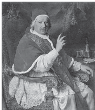
Papa Benedicto xiv. http://es.wikipedia.org/wiki/Benedicto_xiv , 21-09-2009

de Guadalupe: desde la epidemia del matlazahuatl en 1736 la imagen mariana fue vista como virgen de la salud, la sanadora, milagrosa María de Guadalupe. Los sermones hablaron siempre de un doble milagro que colocaba a Guadalupe –la emperatriz americana– en una instancia superior con respecto a la patrona de España: haberse aparecido, dejar su imagen en un material débil como un sayal y permanecer incorruptible con el paso del tiempo. Los milagros se multiplicaron: en la ciudad de México se invocó su imagen para detener las aguas, mientras que en zonas semidesérticas como Zacatecas se agradecieron sus milagros por las lluvias; 4 fue abogada e intercesora de los indios y patrona de cabildos y en el caso de Zacatecas, patrona de la minería.