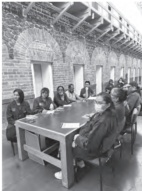
Curso de medidas de conservación preventiva para el manejo de documentos a personal que brinda atención en salas de consulta.