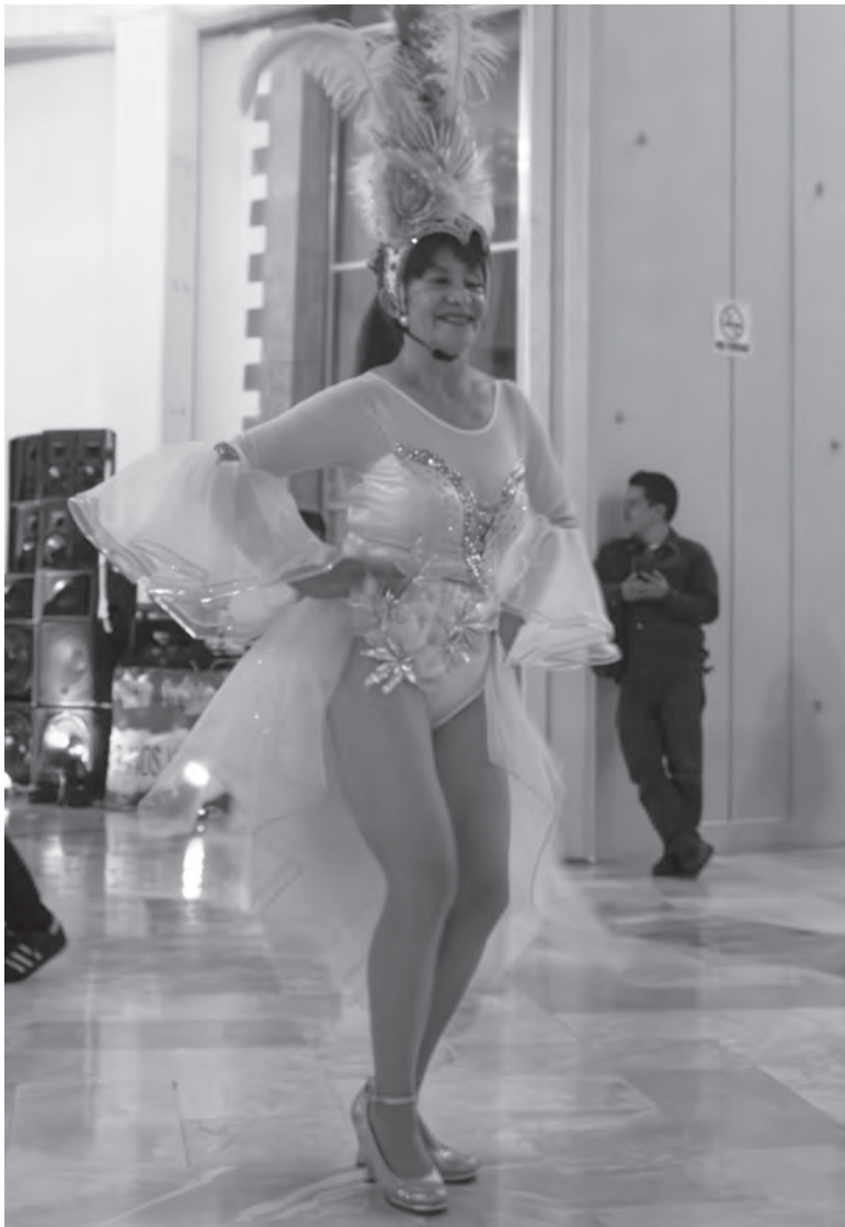
Noche de museos de julio. Conversatorio: La vida nocturna en la Ciudad de México, 1940 a 1950.