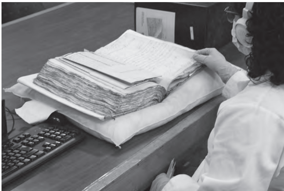
Descripción de un volumen del fondo Comisión Monetaria.