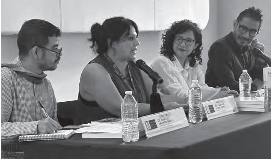
Presentación del libro De sedientos seres. Una historia social del homoerotismo masculino. Ciudad de México, 1917-1952.