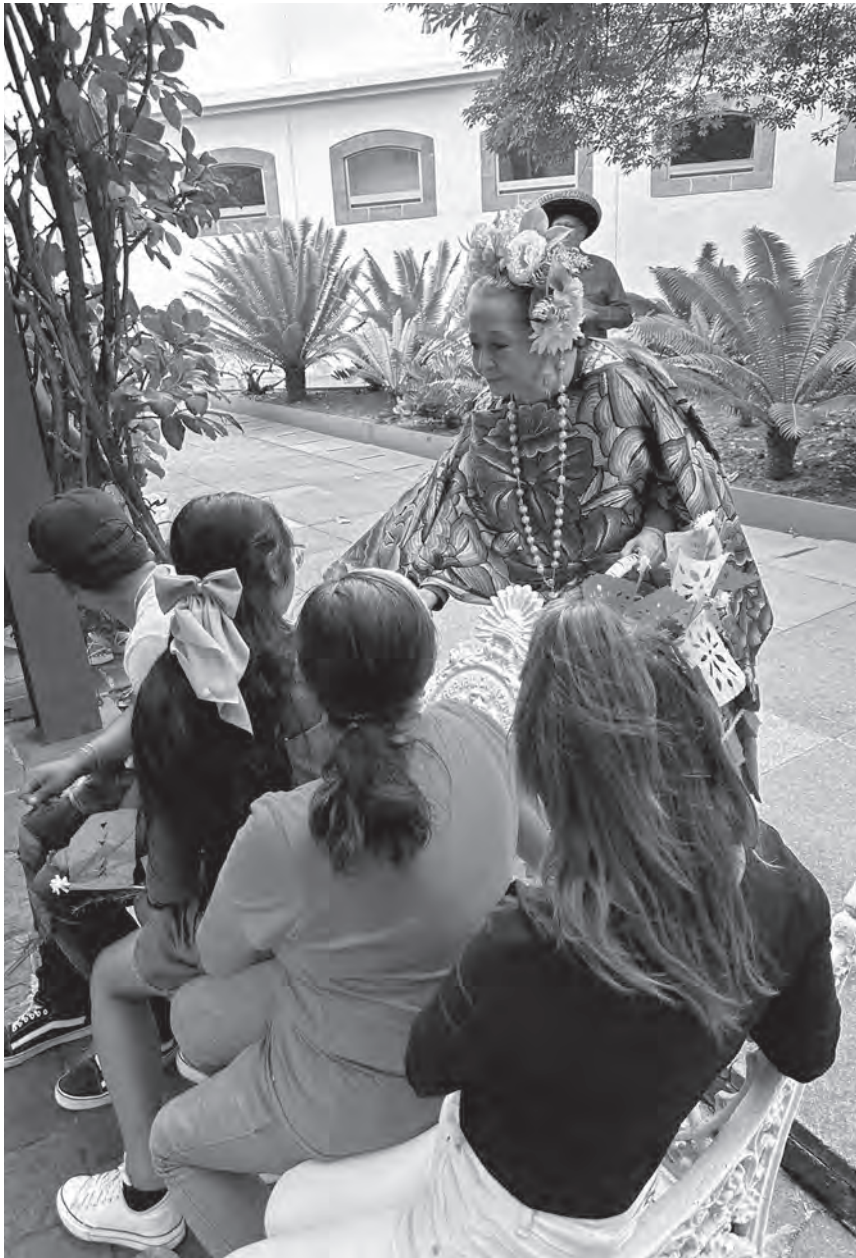
Presentación de la obra Juana Cata: entre el mito y la historia en el marco del Día Internacional de los Museos.