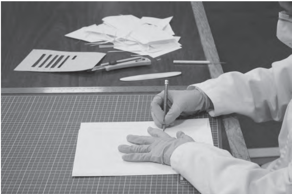
Producción de guardas para la protección de documentos pertenecientes al fondo Comisión Monetaria.

En “De nuestra galería fotográfica” se encuentran imágenes del día a día del archivo. A continuación, se expone una selección de imágenes en las que se retrataron instantes de gran valor, como procesos técnicos de preservación del patrimonio documental; el evento A seis años de la publicación de la Ley General de Archivos: Retos y Realidades de los Sistemas Institucionales de Archivos, en coordinación con el Instituto Mexicano del Seguro Social (IMSS) en el marco del Día Internacional de los Archivos; el Conversatorio: La vida nocturna en la Ciudad de México, 1940 a 1950, actividad del programa Noche de Museos, entre otros momentos.