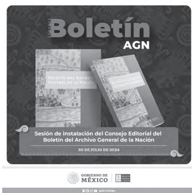
Primera sesión ordinaria del Consejo Editorial del Archivo General de la Nación.