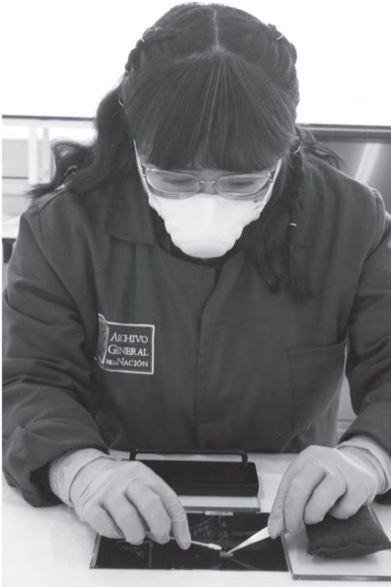
Retiro de cinta adhesiva de material fotográfico.