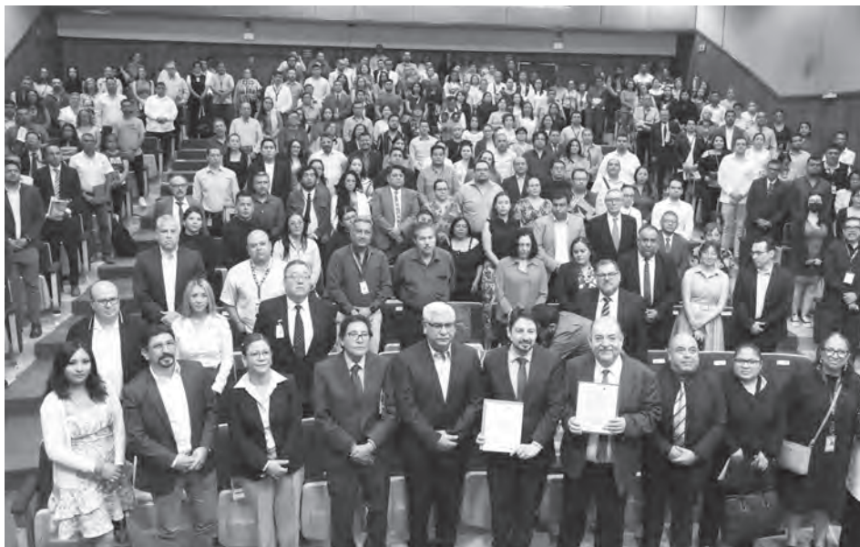
Evento A seis años de la publicación de la Ley General de Archivos: Retos y Realidades de los Sistemas Institucionales de Archivos. 18 y 19 de junio de 2024.