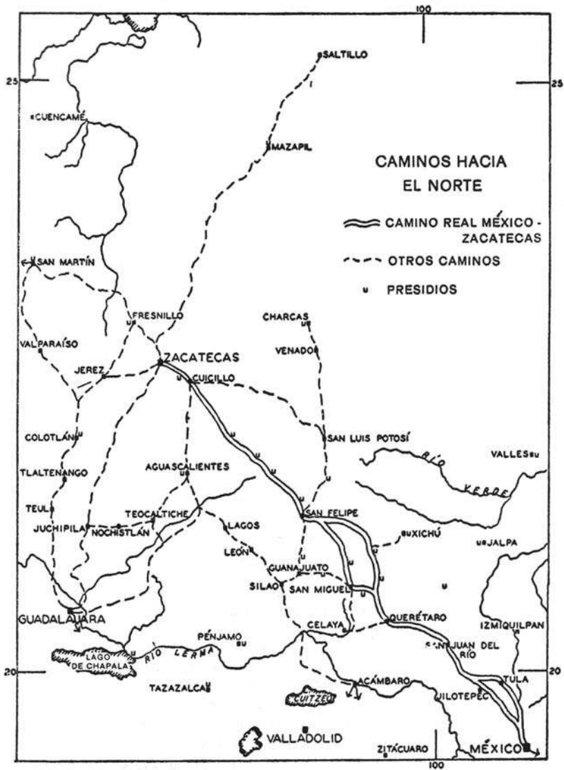
Mapa 1. Caminos hacia el norte. Tomado de Powell, La Guerra Chichimeca , p. 36.