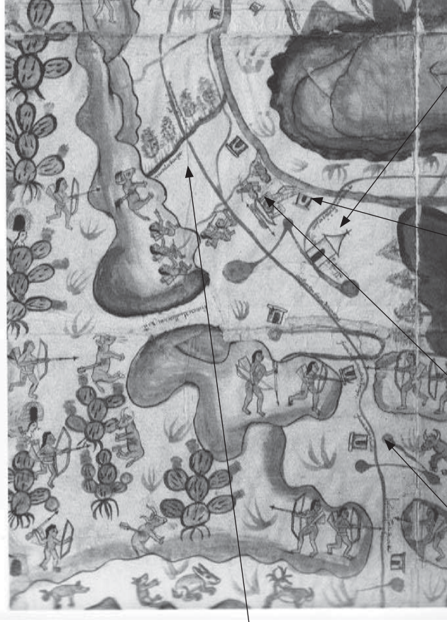
MAPA 3. PARTE SUPERIOR IZQUIERDA