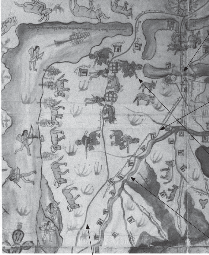
MAPA 3. PARTE SUPERIOR DERECHA