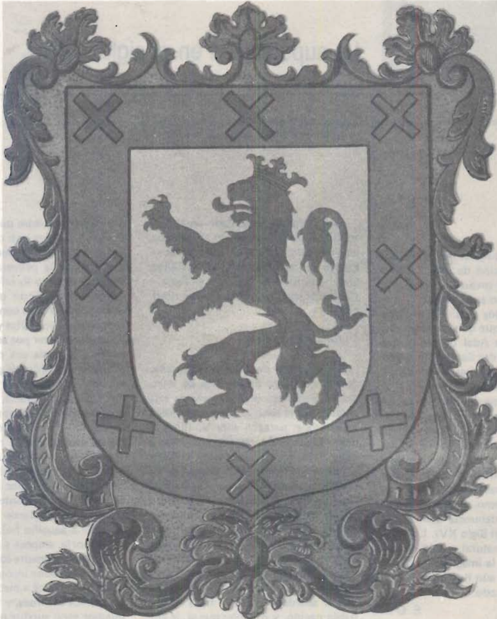
Escudo del marquesado del valle de Oaxaca, 1574-1578. Códices indígenas de algunos pueblos del marquesado del valle de Oaxaca. Talleres Gráficos de la Nación, México, 1933.

Correspondencia de Bucareli, volumen 73.