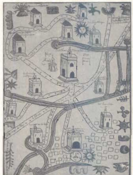
Plano del obispado de Tlaxcala, partido de Cuzcatlán, 1580. Francisco del Paso y Troncoso. Papeles de la Nueva España . Vol. V, anexos, Sucesores de Rivadeneyra, Madrid, 1905.