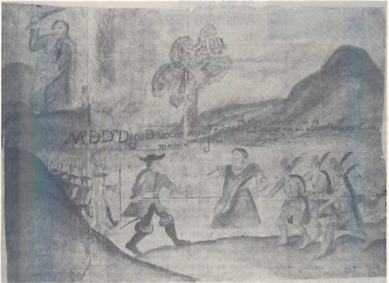
Ilustración perteneciente al Códice de San Bartolomé Cuamancingo, Tlaxcala, 1533. Serie Tierras, vol. 946, exp. 3, f. 27.

blicada por García Pimentel, y el Suplemento, páginas 183 y siguientes del Tomo V de Papeles de Nueva España.