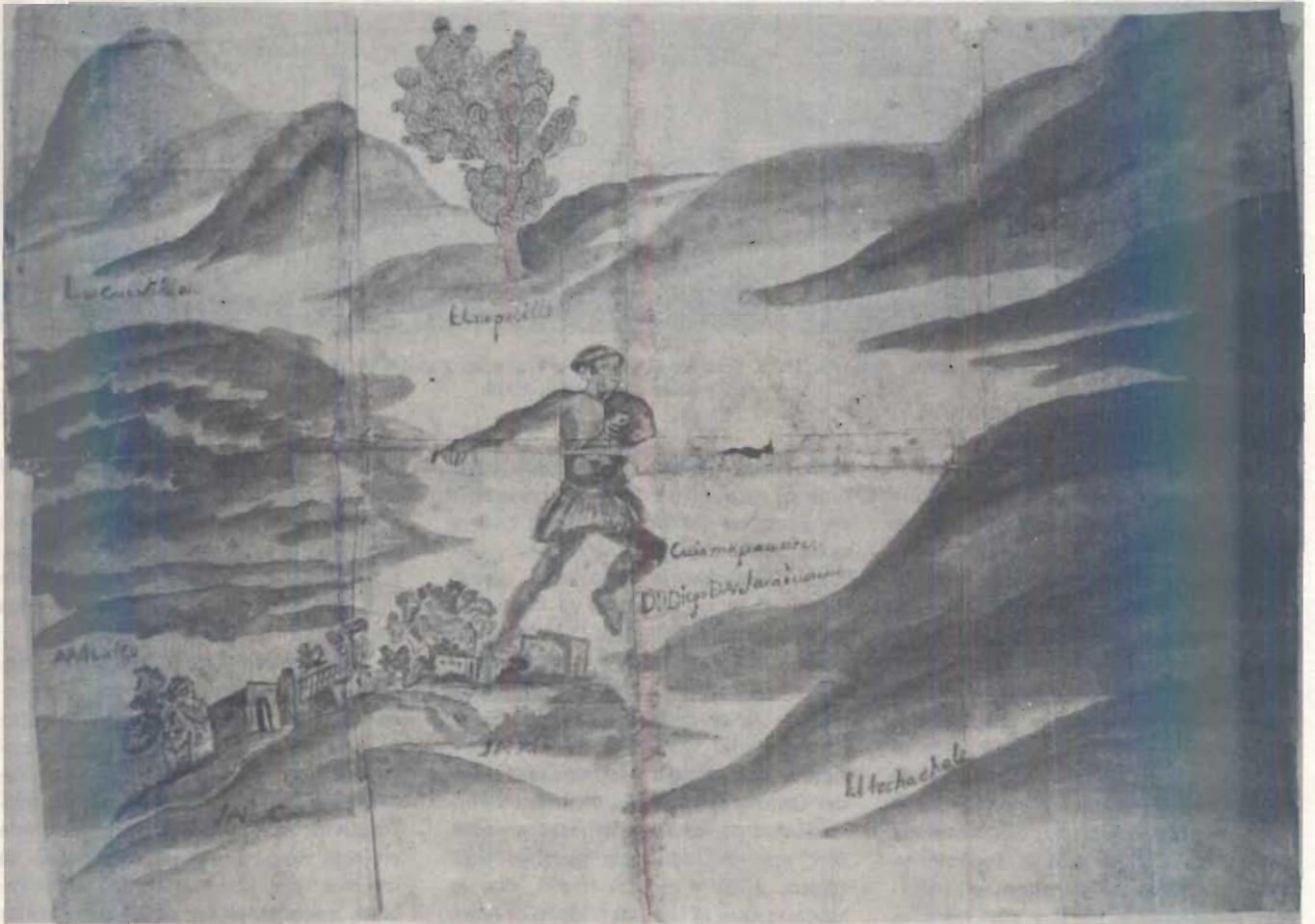
Ilustración perteneciente al Códice de San Ximón, Tlaxcala, 1533. Serie Tierras, vol. 946, exp. 3, f. 26.

4 Sobre todo por lo que se refiere a las variantes de los nombres de los pueblos, que se deben en su mayoría a corrupción de las voces indígenas o a malas lecturas. Un curioso ejemplo de esto último, lo proporciona el pueblo de Orizaba que aparece en algunos documentos como Olicana, obtenido, leyen-