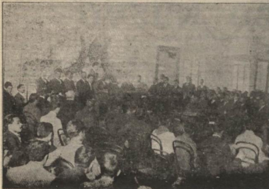
México Nuevo, México, sábado 30 de abril de 1910. Archivo General de la Nación, Hemeroteca.

todos los demás signatarios de dicha recomendación, me llenan de orgullo, no porque crea merecerlas, sino porque al reconocer en mí a un sincero demócrata y concederme virtudes cívicas, rinden un homenaje a la memoria de mi inolvidable padre que me enseñó a ser antes que todo un incondicional servidor del pueblo mexicano.