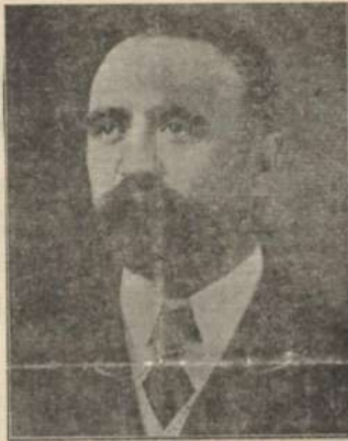
EL C. FRANCISCO I. MADERO.

—En el fondo,—agregó el Sr. Madero,—el partido democrático y el partido antireeleccionista, son uno solo, en cuanto á sus tendencias. Lea usted sus respectivos