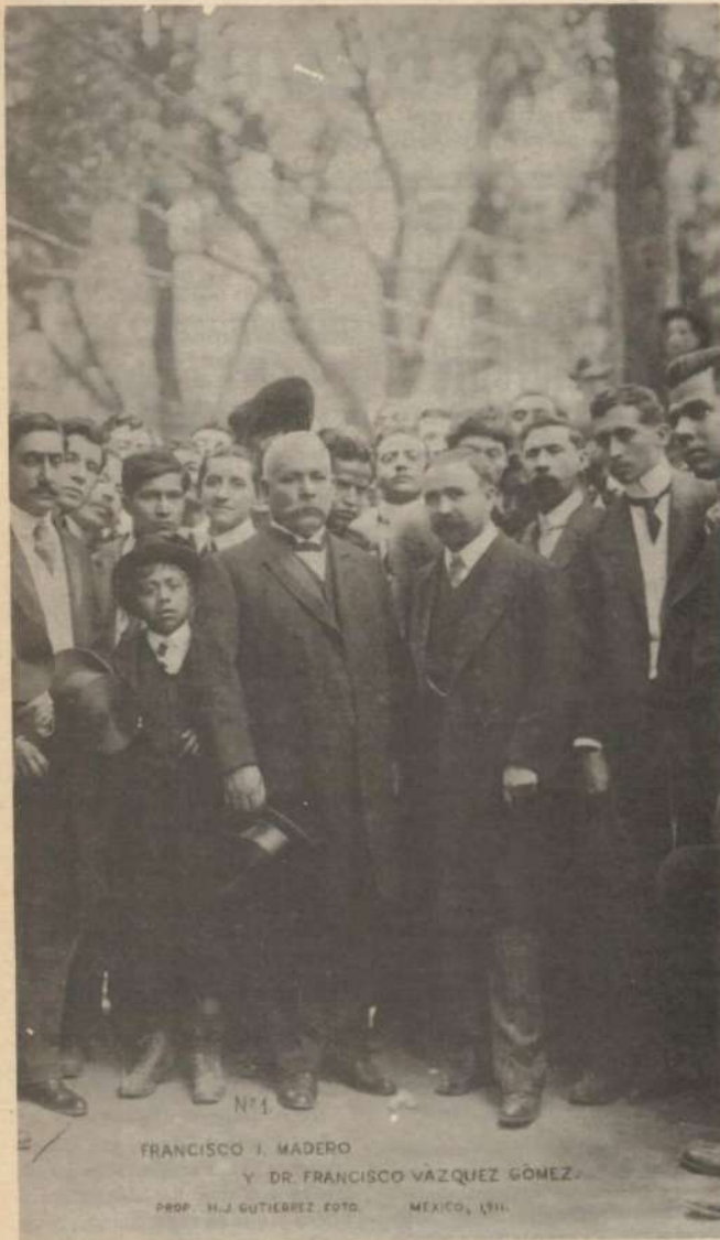
Francisco I. Madero y el doctor Francisco Vázquez Gómez.

credencial aislada, y se le concedió por aclamación.