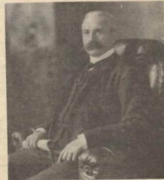
Don Ramón Corral.

Con toda prosopopeya, con el tono de suficiencia que solo ellos, los mismos, tienen dicen: «los antirreeleccionistas desconocen completamente todo lo relativo á la cosa pública; no son capaces de comprender á qué obedecen los pasos políticos y financieros; no saben cuáles son las exigencias de la Nación» y deducen en consecuencia, que de esta ignorancia resulta no haber razón alguna para exigir un cambio de Gobierno. Aparte de que: si los antirreeleccionistas saben ó no todo todo lo relativo á la cosa pública; si son ó no capaces de comprender tal ó cual paso político y financiero y de si saben ó no saben cuáles son las exigencias de la Nación,