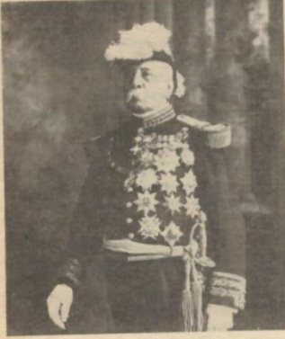
General Porfirio Díaz. Archivo General de la Nación, Documentos de Imagen y Sonido, serie Propiedad Artística y Literaria, colección F. L. Clarke, personajes, foto 13.

mente es también muy capaz de declarar la nulidad de las elecciones. Nadie sabe hasta dónde llegarán los efectos de esta declaración; y aun cuando se empleara el terror, creyéndose un remedio extremo (que haría todavía más odiosa la oligarquía) para tratar de sofocar la energía del pueblo, la pérdida es segura debido á que la opinión pública es contraria; pues la gran mayoría que es la oprimida; la gran mayoría que ya no soporta las vejaciones, los atropellos, las injusticias y desmanes de una minoría absoluta, despótica, intransigente é incapaz de gobernar con la ley y sí á su capricho como lo tiene confirmado en demasía. Pero suponiendo que no se llegue á exagerados extremos, por el momento, en tal caso es aplazar la cuestión; pues á la muerte del General Díaz, se resolverá segura y definitivamente, derrumbándose en uno ó otro caso la llamada garantía de paz y de progreso.