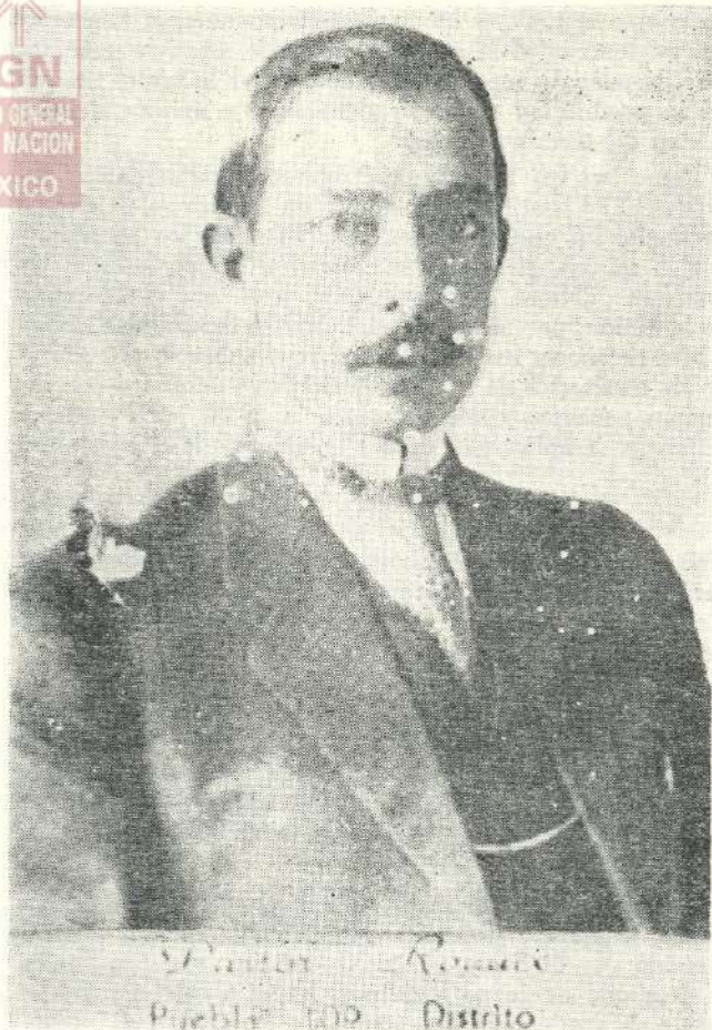
Pastor Rouaix. Puebla, 10º Distrito.

“Que el artículo 15 de la Ley Reglamentaria del Artículo 27 Constitucional en el ramo de petróleo, de 26 de diciembre de 1925, dice: “La confirmación de derechos a que se refieren los artículos 12 y 14 de esta Ley, se solicitará dentro del plazo de un año, contado de la vigencia de esta Ley; pasado este plazo, se tendrán por renunciados esos derechos, y no tendrán efecto alguno contra el Gobierno Federal los derechos cuya confirmación no se haya solicitado.”