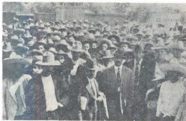
Reunión de obreros en Chihuahua. Fondo Departamento del Trabajo, caja 211, exp. 15.