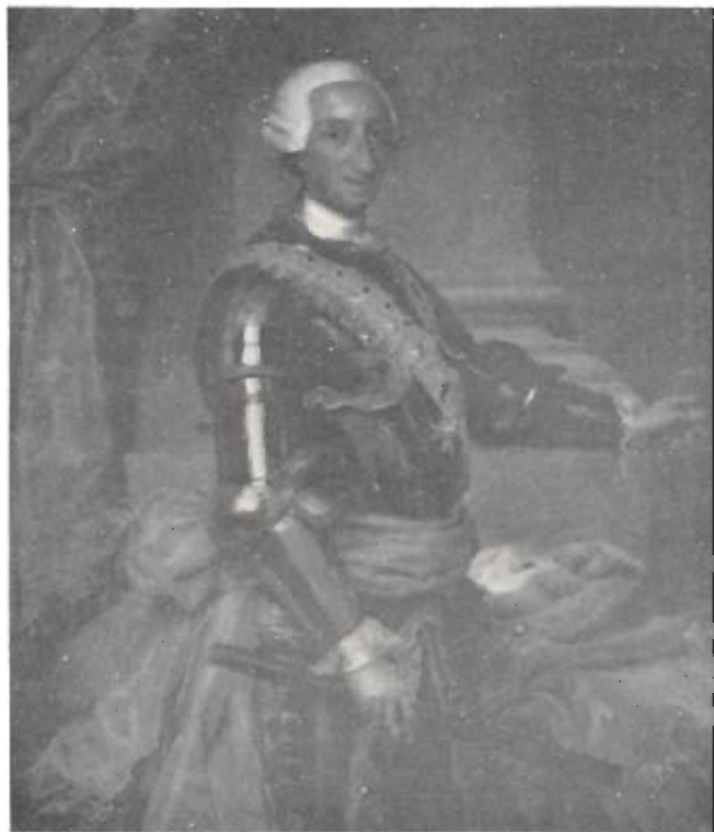
Carlos III. Enciclopedia Salvat Diccionario . Salvat Mexicana de Ediciones, México, 1983, vol. 3, p. 679.

Reconocido desde luego por nuestro Rey y Señor natural el Señor D. CARLOS QUARTO, obedecidas rendidamente sus Reales Ordenes, y las que yo intimo en su agosto nombre en todo lo perteneciente al buen régimen, conservacion y aumento de estos Dominios, y á mantener la quietud y recta administracion de justicia que conviene al servicio de Dios y de nuestro Católico Monarca, se avisará oportunamente lo que deba executarse para la solemnidad de su proclamacion, previniendo desde luego que el Real ánimo de S. M. declarado en la mencionada Real Orden de veinte y tres de Diciembre último, es de que, tanto en los públicos regocijos por su feliz exáltacion al Trono, como en las fúnebres demostraciones que han de preceder por el fallecimiento de su Augusto Padre, no se hagan mas gastos que los muy precisos, de suerte que los excesos no conviertan en vanidad ó profusion unos actos que solo deben tener por objeto la Religión, y una manifestacion sincera de la fidelidad y amor de los Vasallos al Soberano, cuyas Reales, sabias y piadosas Resoluciones deberán tenerse muy presentes para no causar ni permitir se cause perjuicio, vejacion ni molestia á la gente pobre ni á los Indios, á quienes no ha de obligarse en manera alguna á contribuciones, derramas ni gravámen, con apercibimiento que de lo contrario tomaré las severas providencias que