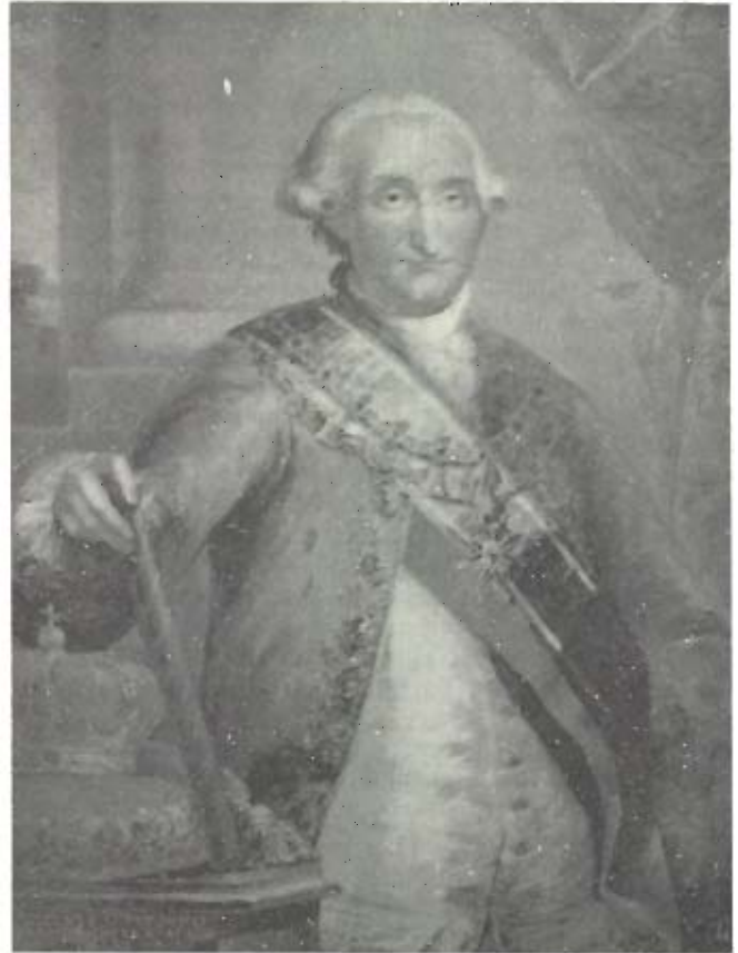
Carlos IV. Enciclopedia Salvat Diccionario. Salvat Mexicana de Ediciones. México, 1983, vol. 3, p. 679.

2. La iluminacion se dispondrá de modo que no pueda manchar ni causar el menor perjuicio á los concurrentes ó expectadores, baxo la pena de pagar los daños, cuyo punto se recomienda mucho á los Vecinos, prohibiendo absolutamente desde ahora para siempre las hogueras y luminarias de ocotes, por ser arriesgadas, incómodas y nada decentes, baxo la pena de diez pesos á los contraventores.