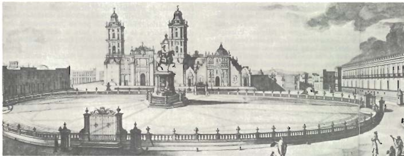
Estatua ecuestre de Carlos IV. Cuarenta Siglos de Arte Mexicano . Herrero. Italia, 1981, 2ª ed., vol. 4, p. 367.

En los dias 17, 18 y 20 se publicaron de órden del Exmô. Señor Virrey los tres Bandos siguientes: