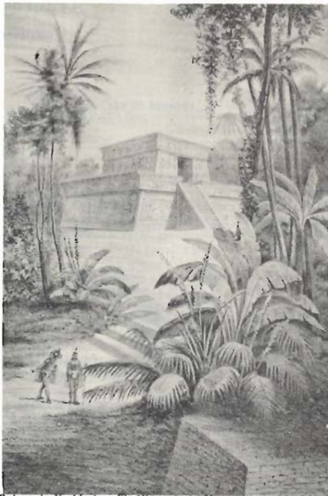
Ruinas de Xochicalco. El Album de la Mujer, Ilustración Hispano-Americana . México, 24 de febrero de 1889, año VII, tomo XII, núm. 8, p. 61.