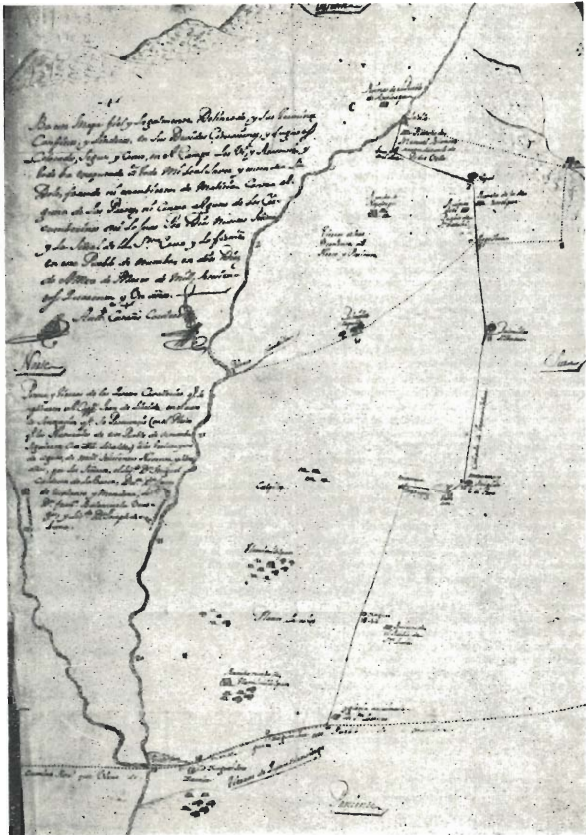
Figura 2. Mapa del pueblo de Tlahuimilolpan, jurisdicción de Otumba, año de 1711. Archivo General de la Nación, Serie: Tierras, Galería 1, Mapoteca, núm. cat. 1200.