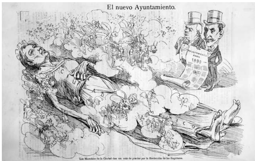
Fig. 3. Sin firma. “El nuevo Ayuntamiento. Los Microbios de la Ciudad dan un voto de gracias por la Reelección de los Regidores” en El Hijo del Ahuizote . México para los mexicanos. Semanario de oposición feroz e intransigente con todo lo malo. Fundador, director y propietario: Daniel Cabrera, tomo XIV, núm. 662, México, 1 de enero de 1899, p. 12.

almenado, en una probable reminiscencia de los pretils del castillo dorado de tres torres representado en el escudo de armas. 23