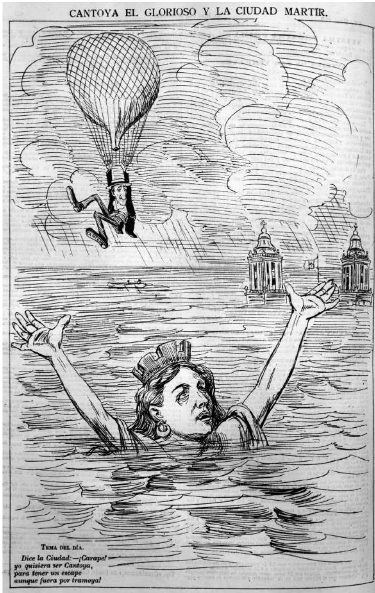
Fig. 4. Sin firma. "Cantoya el glorioso y la ciudad mártir" en El Hijo del Ahuizote . México para los mexicanos. Semanario de oposición feroz e intransigente con todo lo malo. Fundador, director y propietario: Daniel Cabrera, tomo XIV, núm. 688, México, 2 de julio de 1899, p. 432. Biblioteca Miguel Lerdo de Tejada. Reprografía: Gerardo Vázquez Miranda.