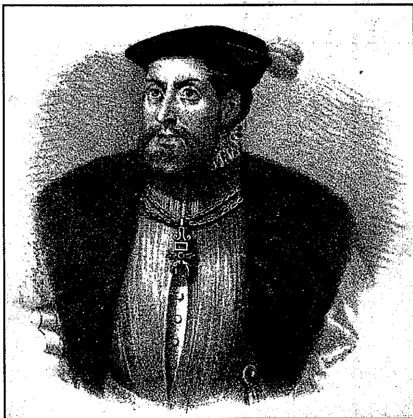
Carlos V de Alemania, I de España.

La detallada catalogación de los títulos, que se sintetizaba con los principales de ellos en los actos públicos comunes, era, en cambio, habitual y precisa en aquellos que pudieran tener particular relevancia jurídica o política. Se trataba, naturalmente, de una cautela legal y de una exhibición que tomaba su significado también en el plano de la imagen y del prestigio de una potencia que podía enorgullecerse de tantos títulos. Los largos registros de los mismos en actos, diplomas, tratados, etcétera, no expresaban, sin embargo, sólo una preocupación legalista o un criterio de afirmación simbólica. Independientemente de todo ello, expresaban, en efecto, con gran fidelidad la validez efectiva de las cosas, la composición, de hecho y de principio, del complejo aglomerado político en que consistía la potencia que exhibía tales títulos.