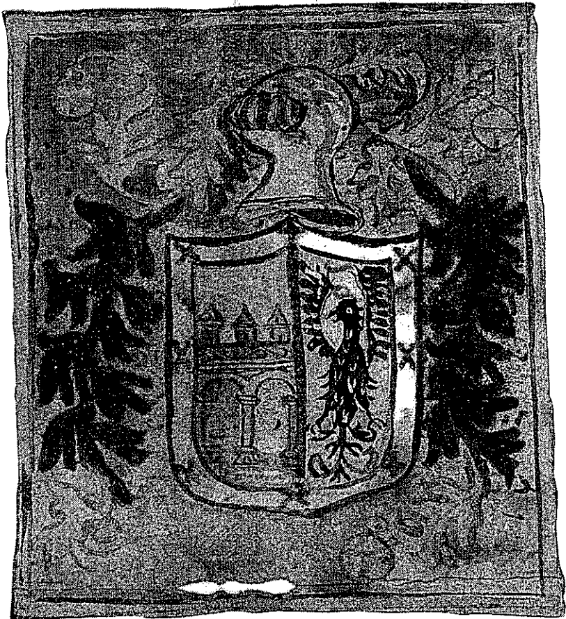
Escudo de armas de Carlos V, [1603]. AGN, Vínculos, vol. 20, exp. 11, f. 2v.

soberano era el centro y el más directo propulsor y del que consejos y secretarías fueron las articulaciones concretas. Tanto con Carlos V como con Felipe II esto tuvo una completa confrontación en la realidad. El emperador mantuvo a la alta nobleza lejos de los consejos y fue absolutamente drástico en la recomendación, dada a su hijo y sucesor, de que hiciera lo posible porque a los grandes no les permitiera adquirir peso e influencia en el gobierno. Fue entonces cuando maduró también la fortuna político-social de los letrados, de la gente media, que los soberanos utilizaron para los cargos periféricos y centrales de la monarquía. Sus características, tanto por lo que respecta a las secretarías como a los consejos, las audiencias y las otras instituciones de gobierno, han sido desde hace tiempo aclaradas,