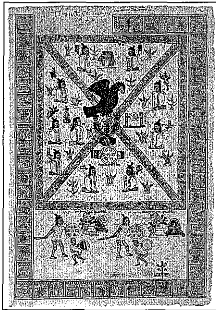
Imagen de la invitación a la inauguración de la exposición documental "Orígenes de nuestra ciudad", Archivo General de la Nación, 14 de marzo de 1997.