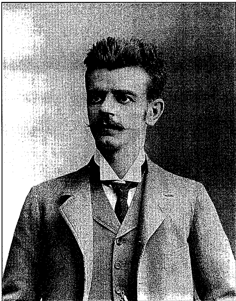
Guillermo Kahlo (1872-1941), fotógrafo.